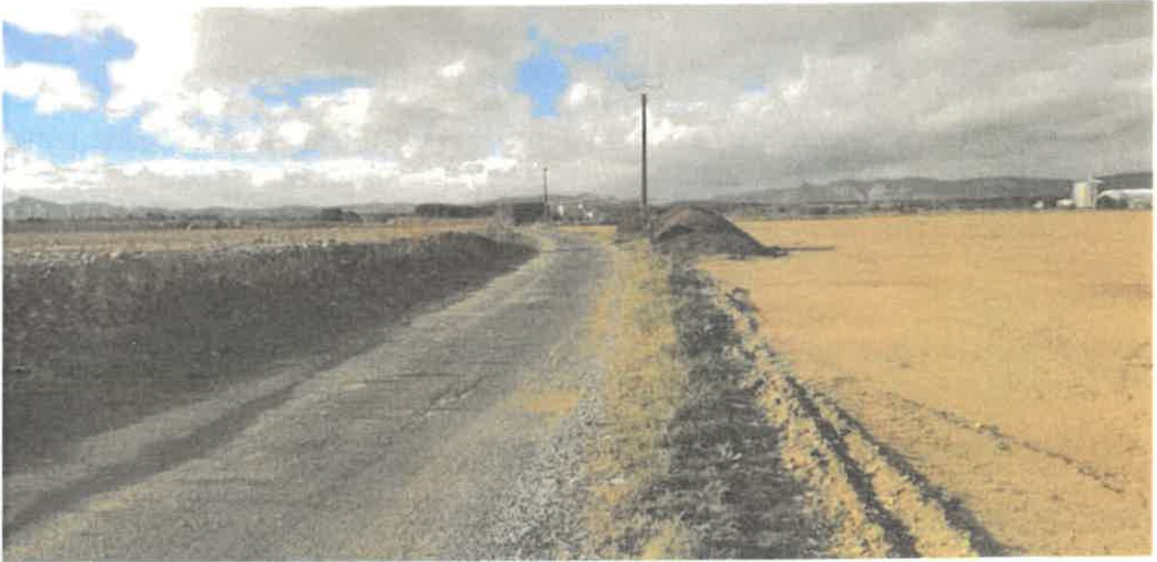
Illustration 1: Élévation du terrain naturel parcelle CT173 (côté gauche de la route)