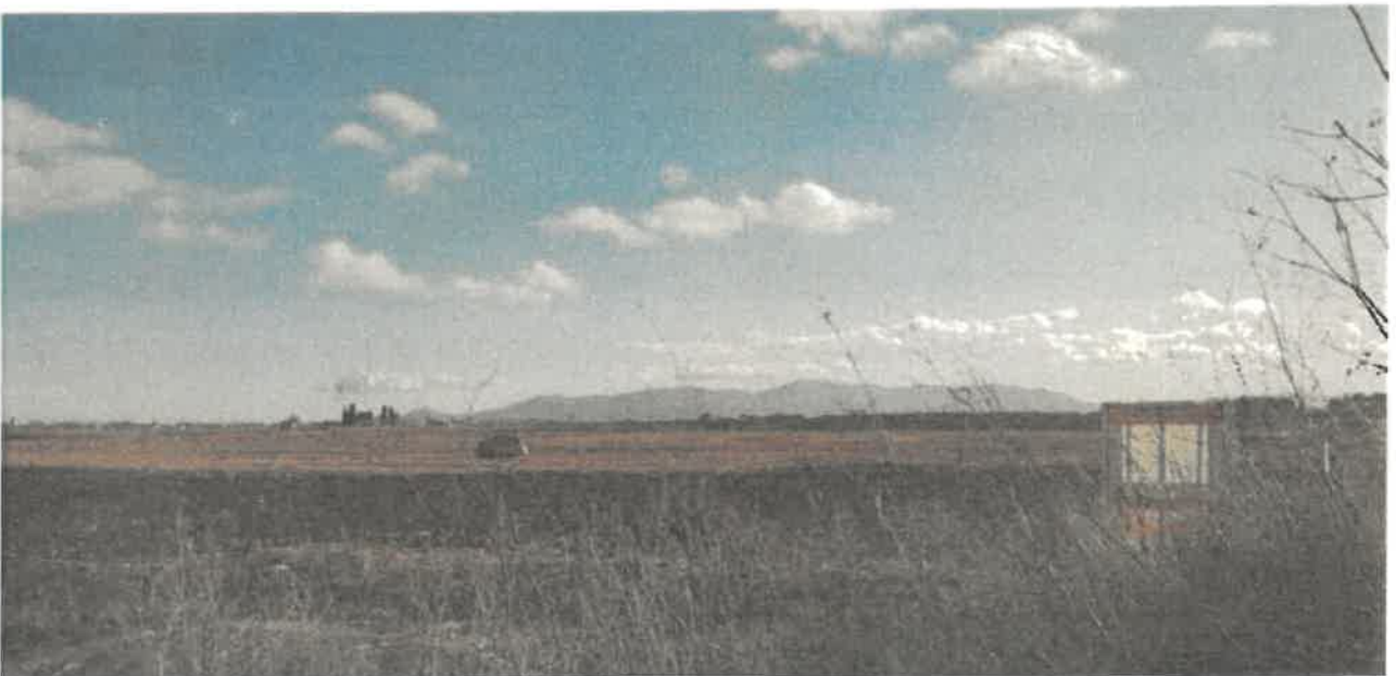
Illustration 2: Élévation du terrain naturel parcelle CT182