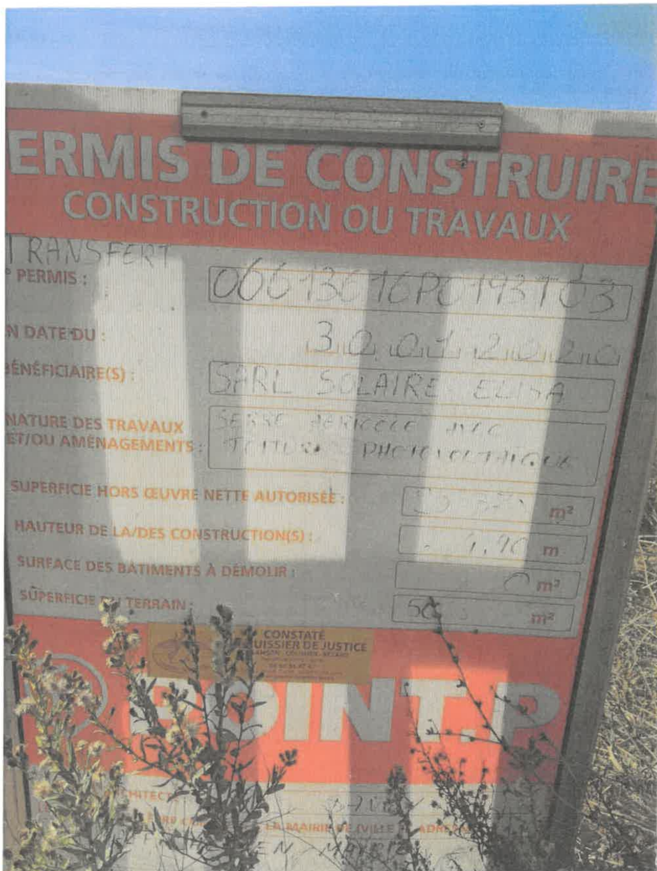
Figure 1: Affichage permis de construire sur la parcelle CT182