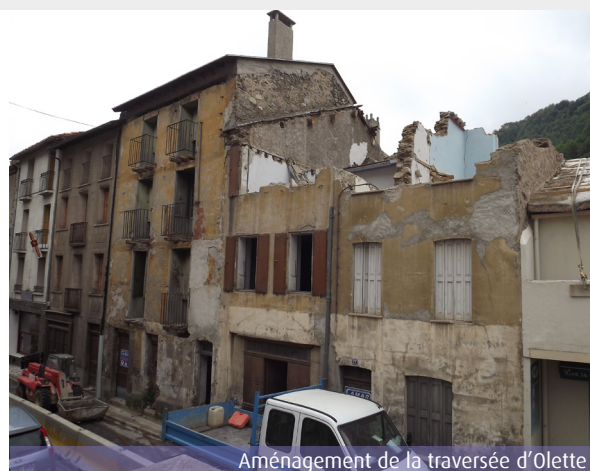
Aménagement de la traversée d'Olette

2014 : enquête publique « Loi sur l'eau » - déviation de Marquixanes. Finalisation du dossier réglementaire concernant la protection des espèces protégées.