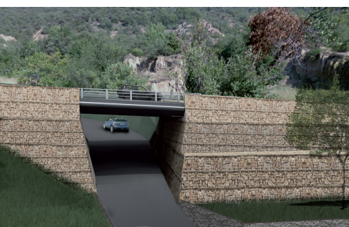
Image 3D du futur pont supérieur de Flassa

L'ensemble des travaux de la déviation de Joncet devrait s'élever à 20 millions d'euros financés par l'Etat.