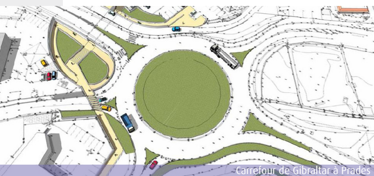
Carrefour de Gibraltar à Prades