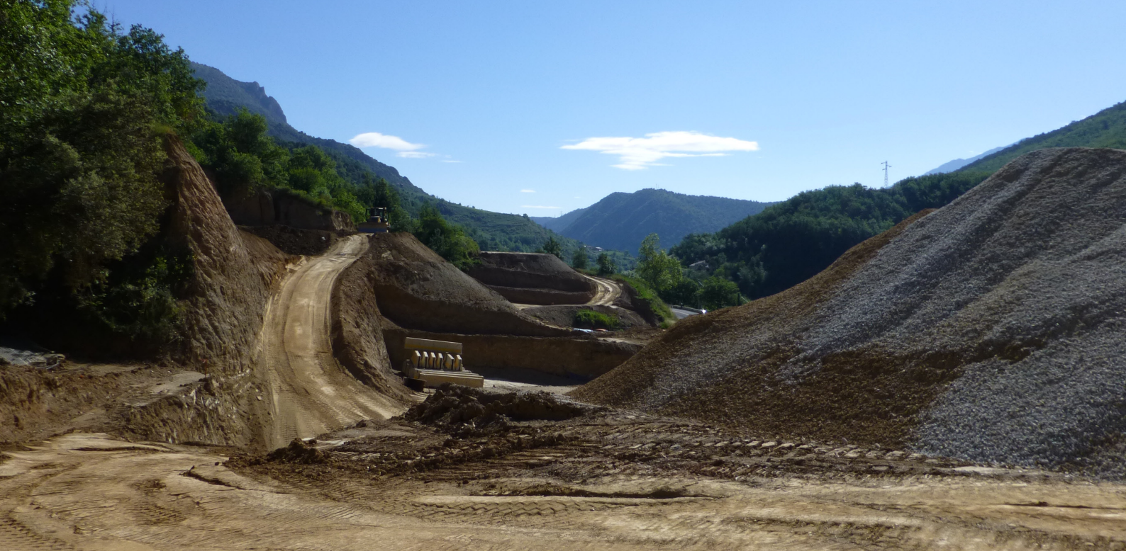
Les travaux de la future déviation de Joncet